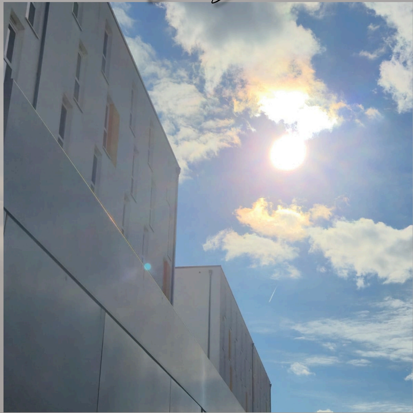
Die Sonne lugt hinter den Mainzer Wolken hervor

ezn habe deheiniu greezer kraft danne unsippiu geselleschaft, gerate si ze guote; und sint si in ir muote getriuwe under in beiden, sô sich gebuoder scheiden.* Hartmanns von Aue »Iwein«