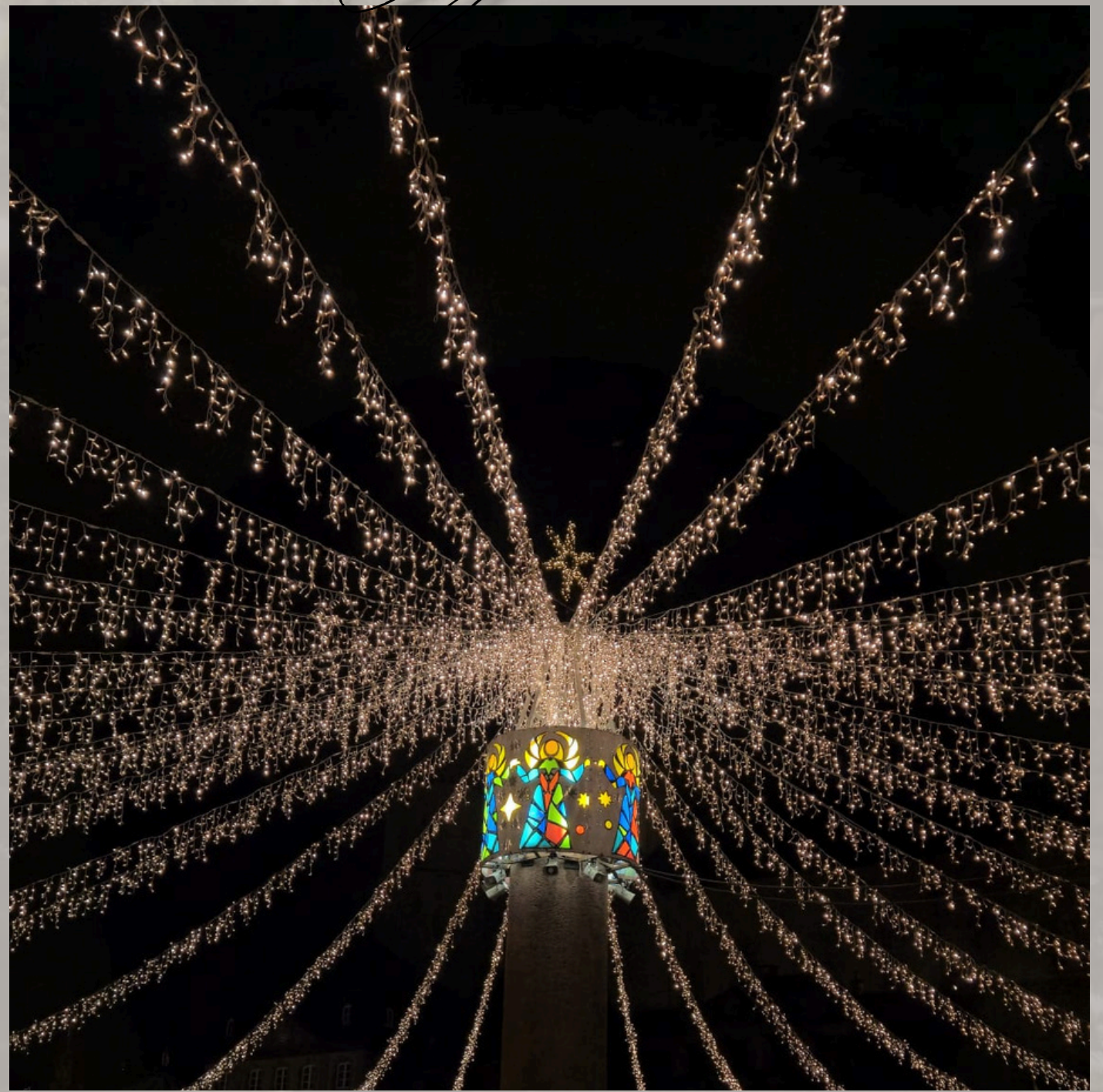
Das Weihnachten in Mainz, unvorstellbar ohne Glühwein und die Lichter des Weihnachtsmarktes