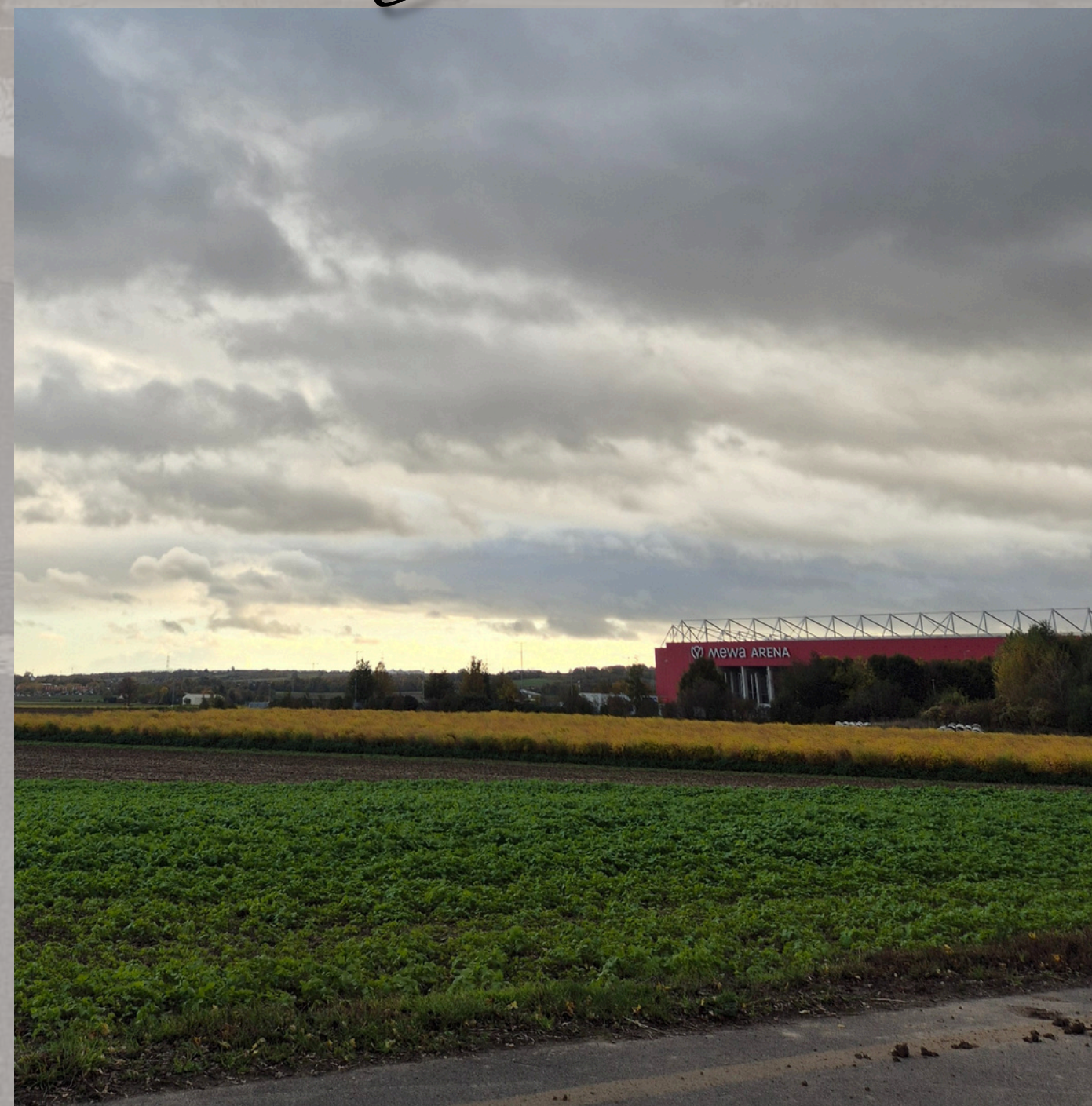
Die vielfältigen Farben rund um die MEWA ARENA , sportliche Heimat des 1. FSV Mainz 05

Das Leben ist wie ein Spiel: Was dich nicht umbringt, macht dich stärker!