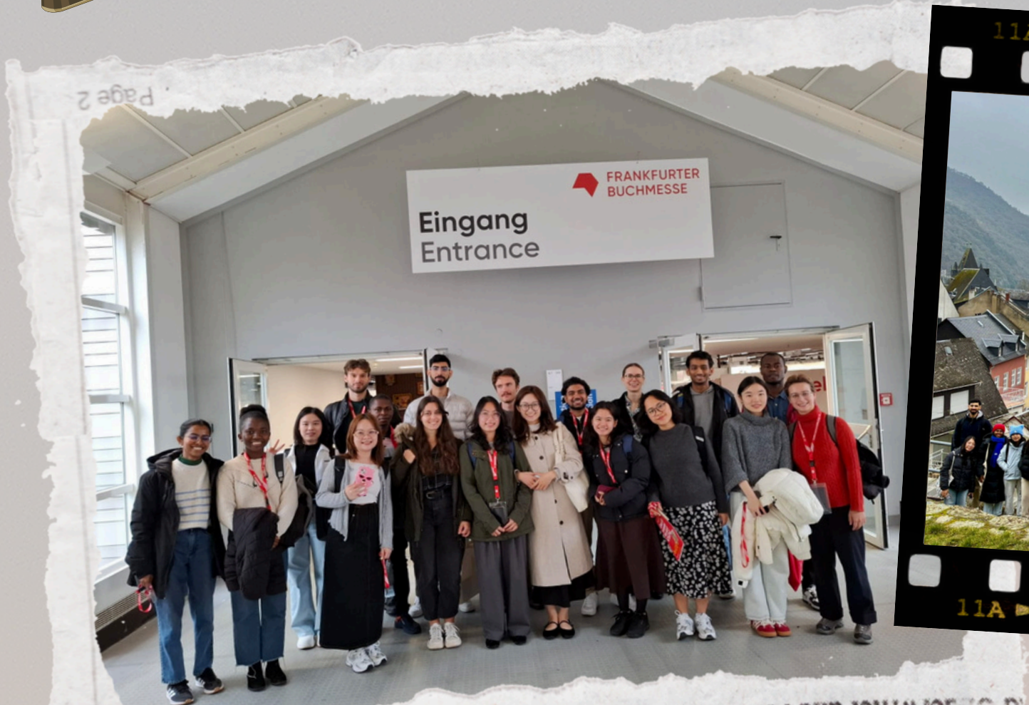
Frankfurter Buchmesse, 16.11.2025