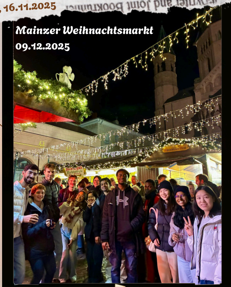
Mainzer Weihnachtsmarkt 09.12.2025