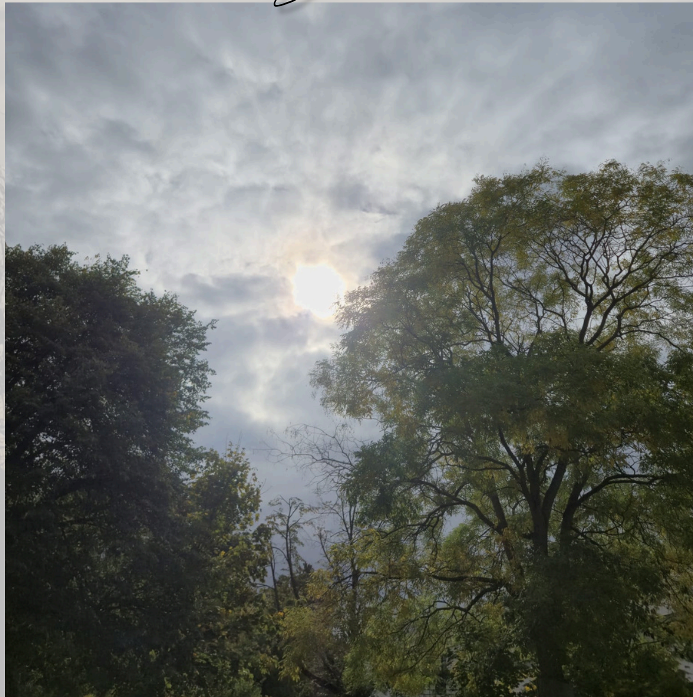
Die Mainzer Baumkronen, die im Laufe des Herbstes ihre Blätter verlieren