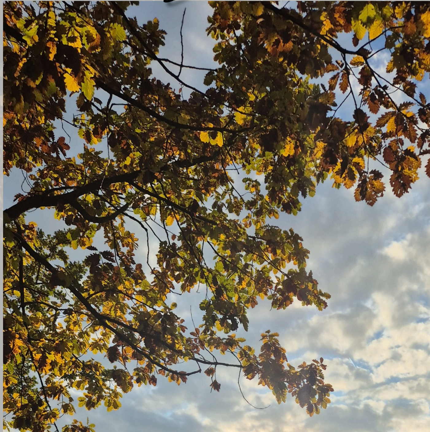
Die vielfältigen Farben der Blätter der Mainzer Bäume