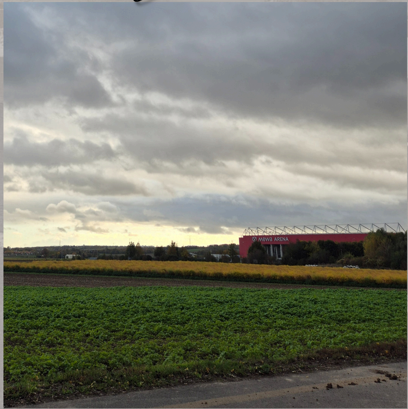
Die vielfältigen Farben rund um die MEWA ARENA , sportliche Heimat des 1. FSV Mainz 05

Das Leben ist wie ein Spiel: Was dich nicht umbringt, macht dich stärker!