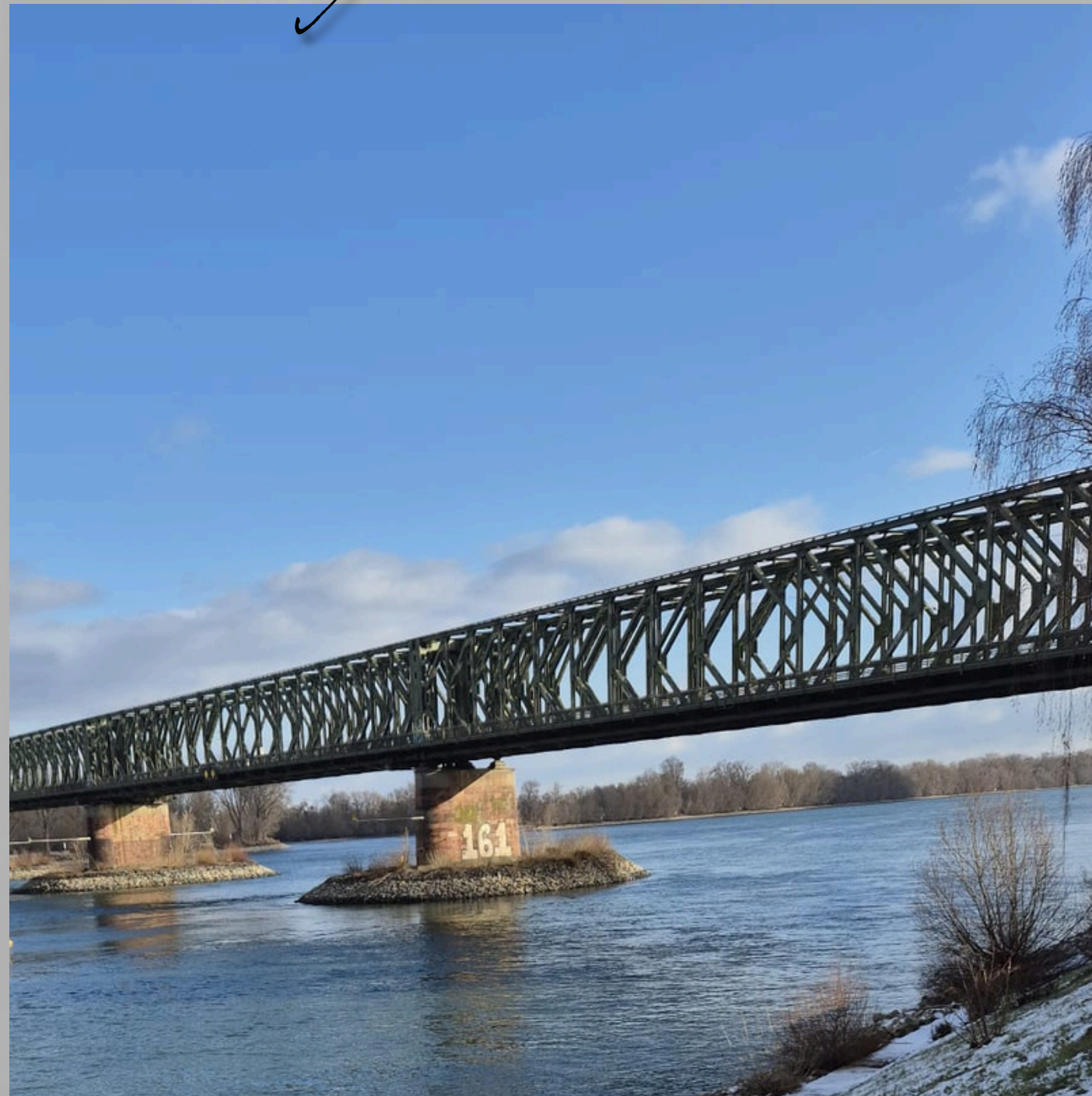
Der Rhein , der für seine große Konzentration an Burgen, Festungen und Ruinen entlang seiner Ufer bekannt ist