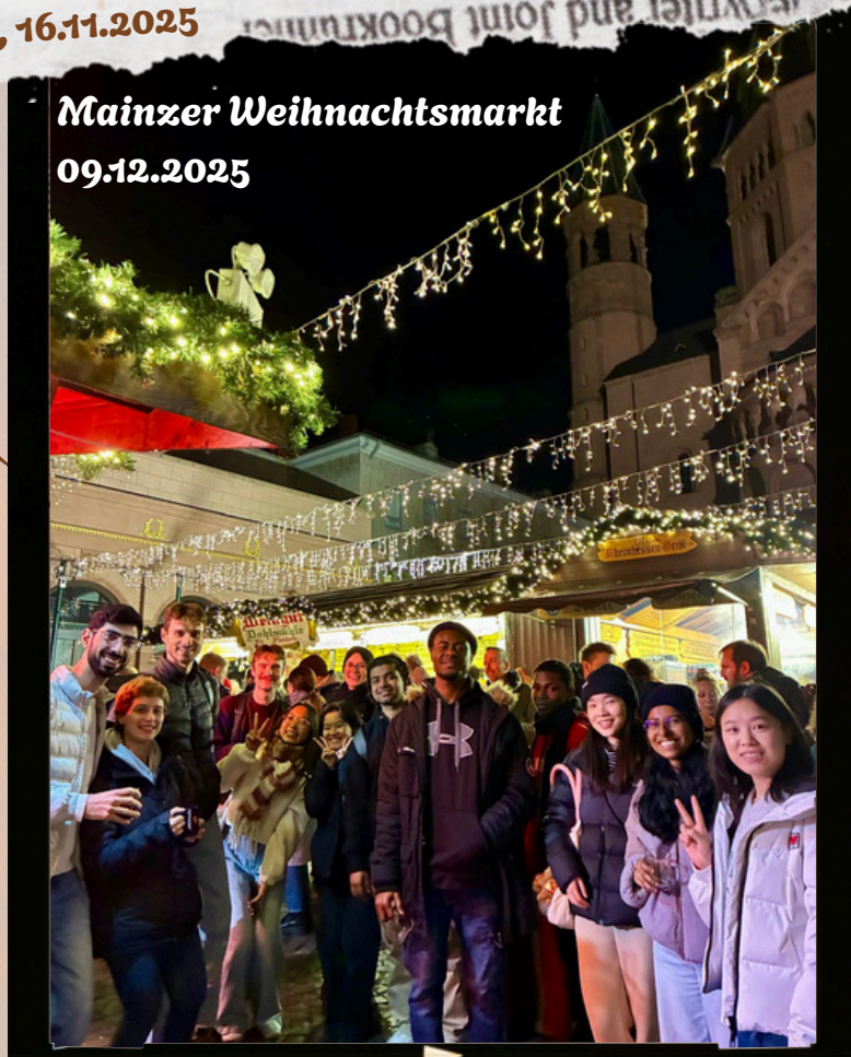
Mainzer Weihnachtsmarkt 09.12.2025