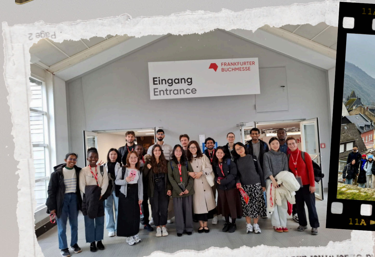
Frankfurter Buchmesse, 16.11.2025