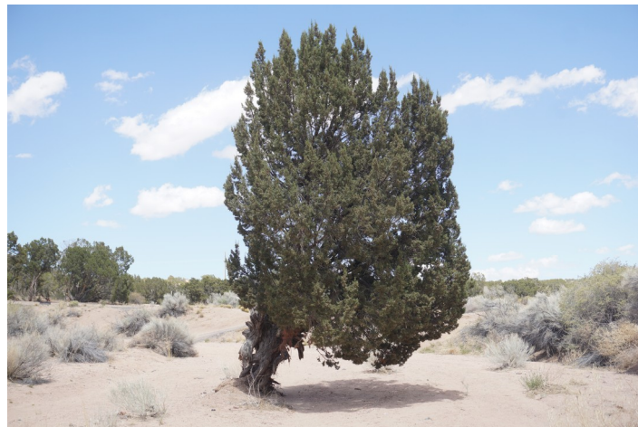
Beim Rio Grande, New Mexico