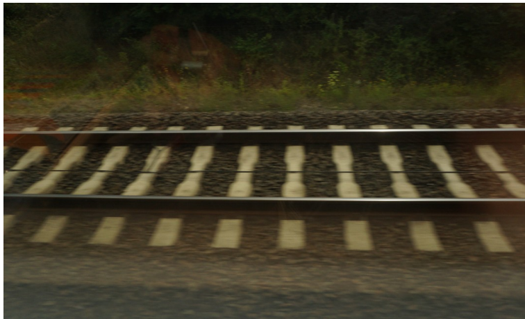
Gleise Richtung Frankfurt und Freiburg