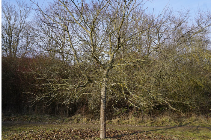
Baum am Joggingweg, Mainz