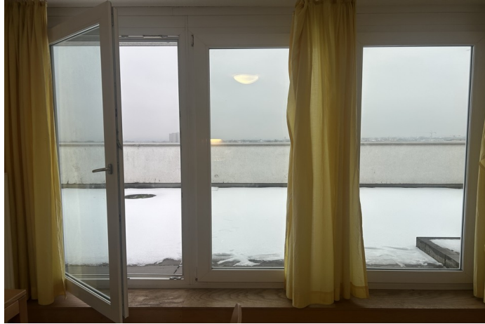
Wohnung 13: Mainz