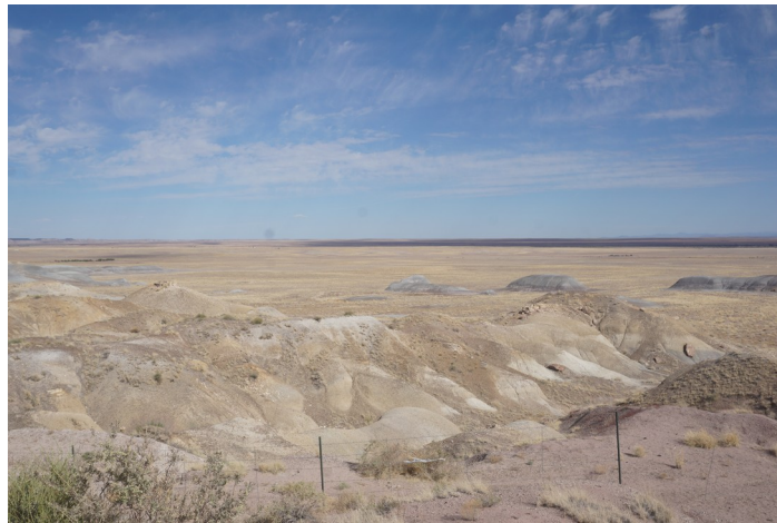
Trockene Gegend 2: Arizona